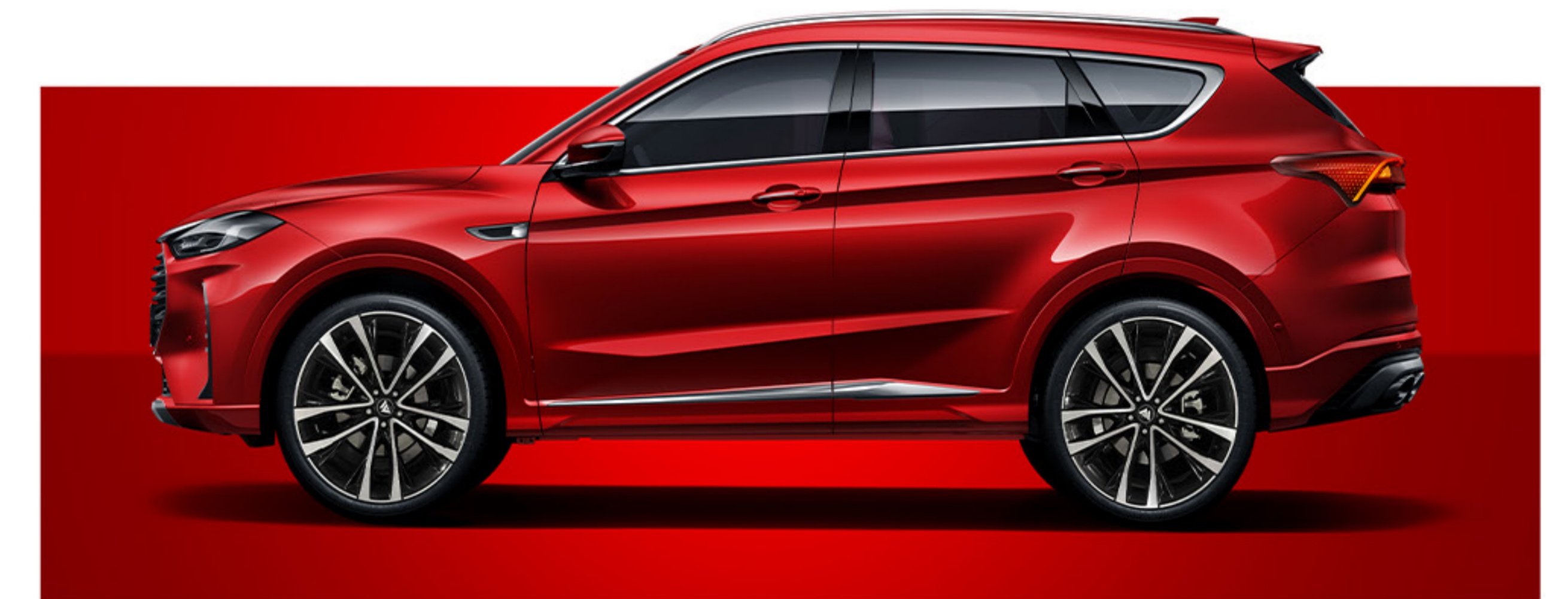
Un design épuré et dynamique avec des lignes fluides et des détails fins qui ajoutent une touche de sophistication.