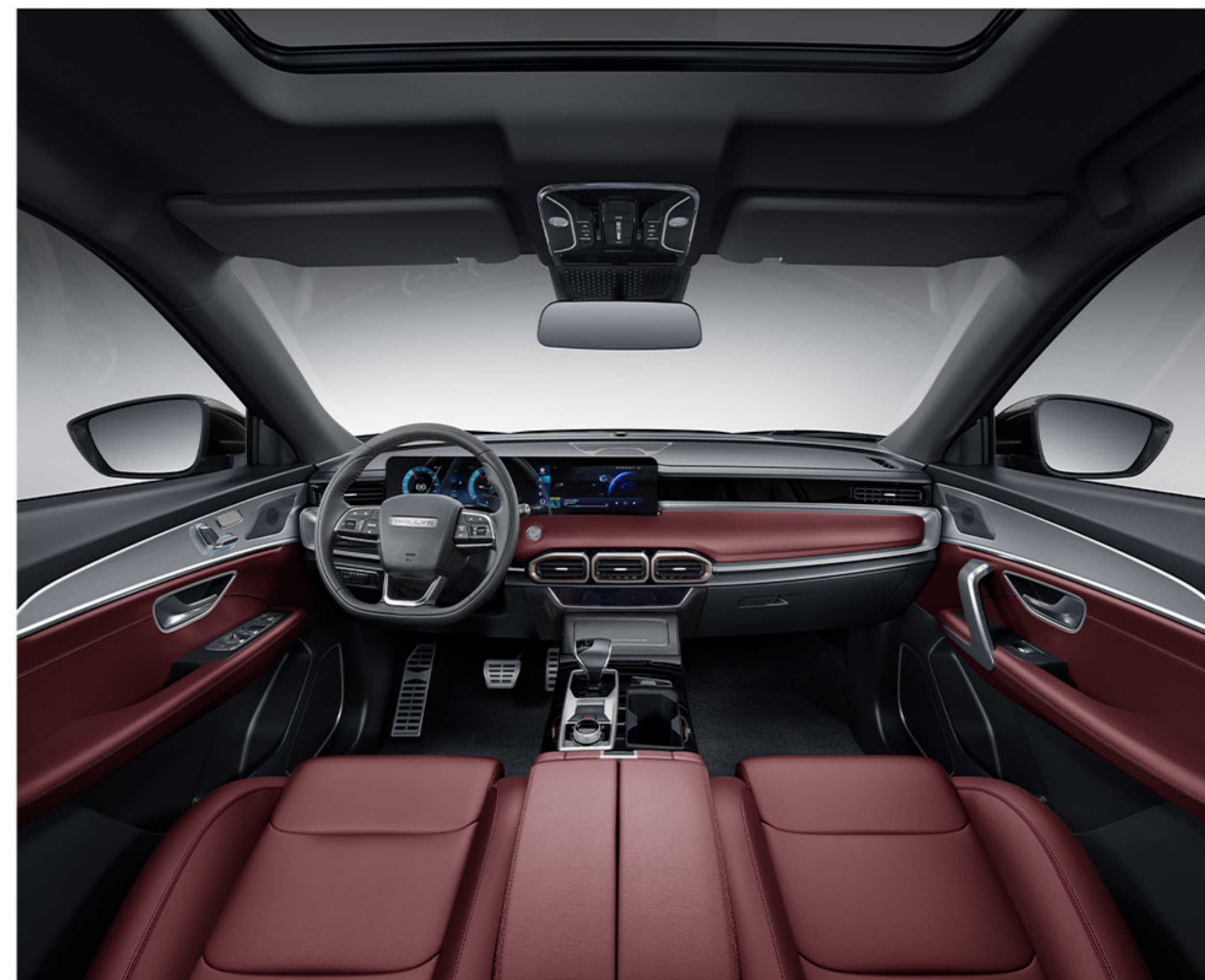
Un intérieur en cuir élégant où chaque surface respire le luxe et le confort. Un coffre généreux offrant un espace ample et pratique pour ranger tous vos bagages et équipements.