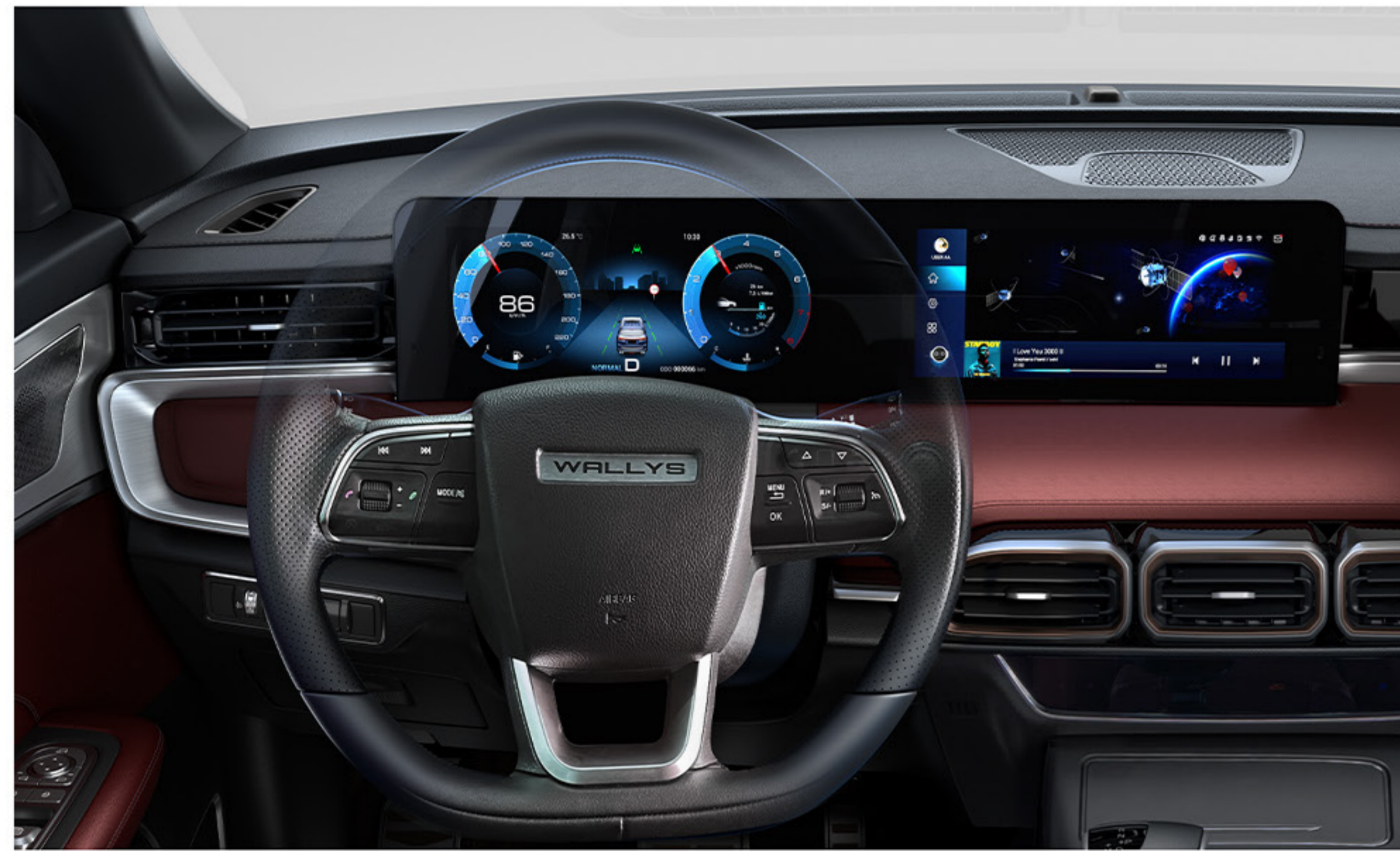
Un intérieur raffiné - doté d'un écran tactile de 10,25"