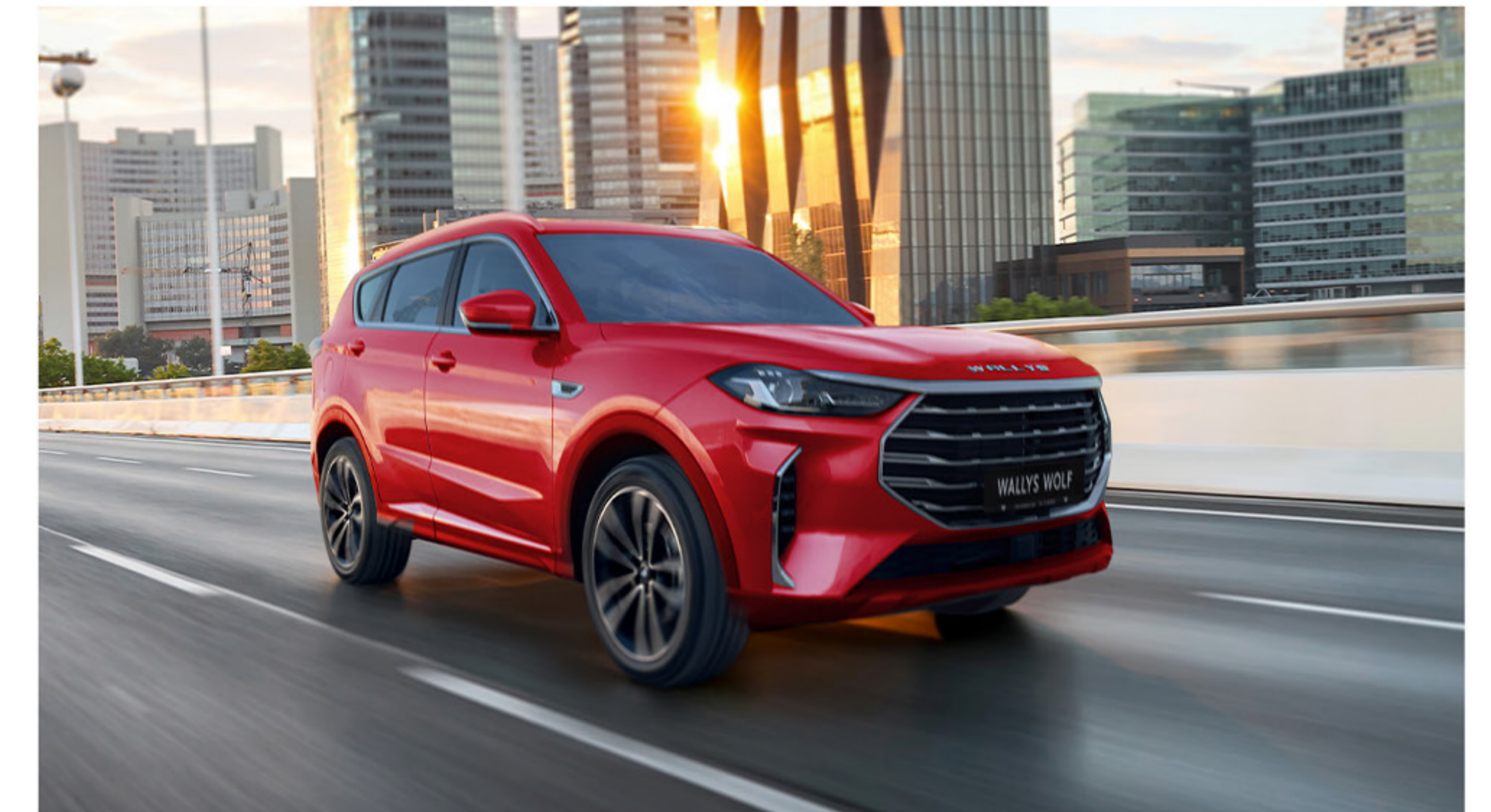
Une fusion captivante de luxe et de puissance.