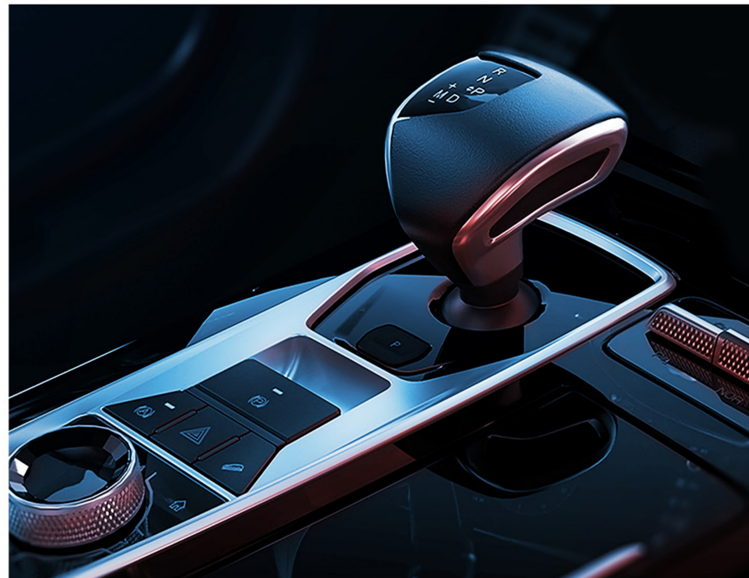
Une boîte automatique offrant une expérience de conduite fluide.