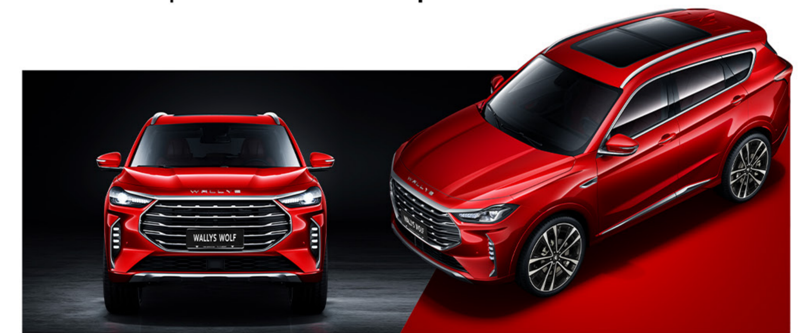
La Wolf ne manque jamais d'attirer les regards et d'impressionner par son allure distincte et captivante.