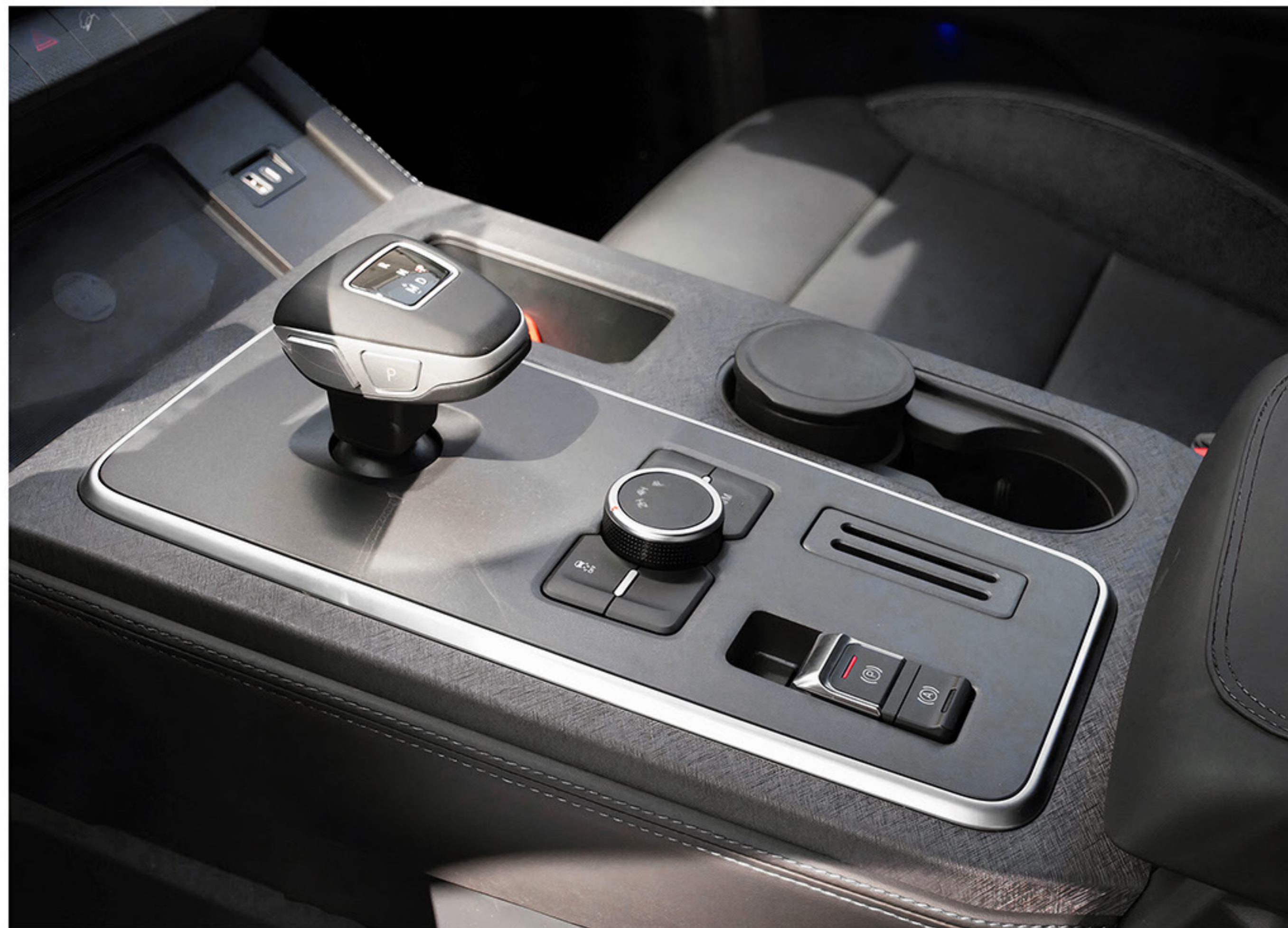
Une boîte automatique offrant une expérience de conduite agréable.