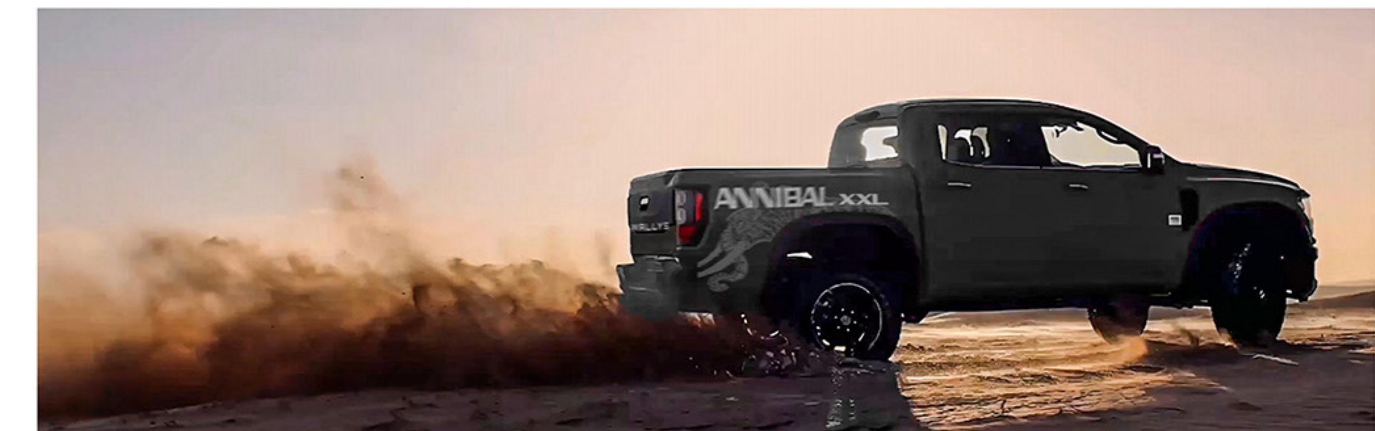
Le XXL ne manque jamais d'attirer les regards et d'impressionner par son imposante allure.