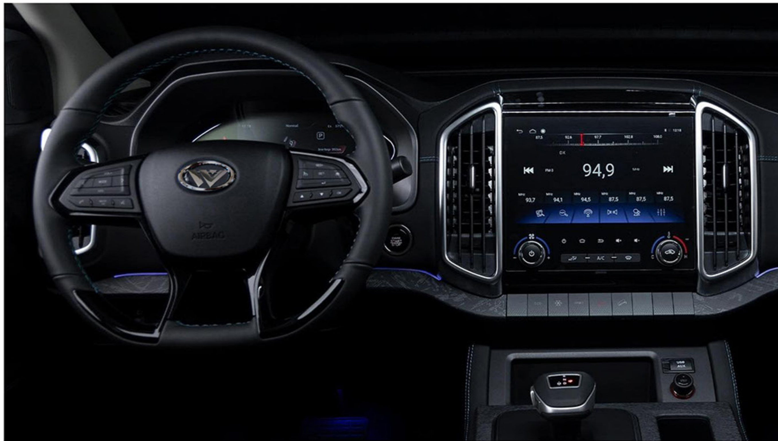
Un intérieur raffiné - doté d'un écran tactile de 10,25"