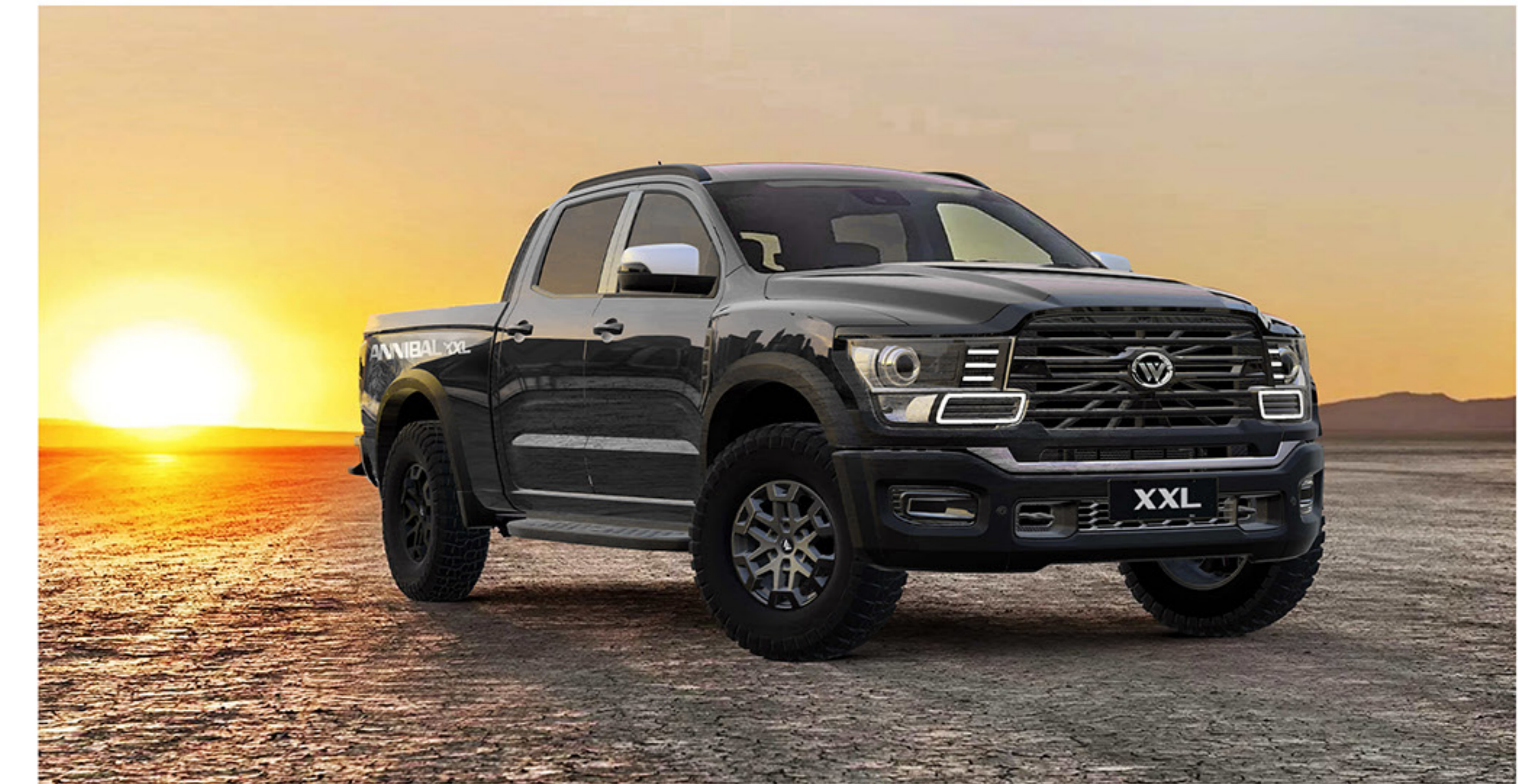
Une fusion captivante de confort et de puissance.