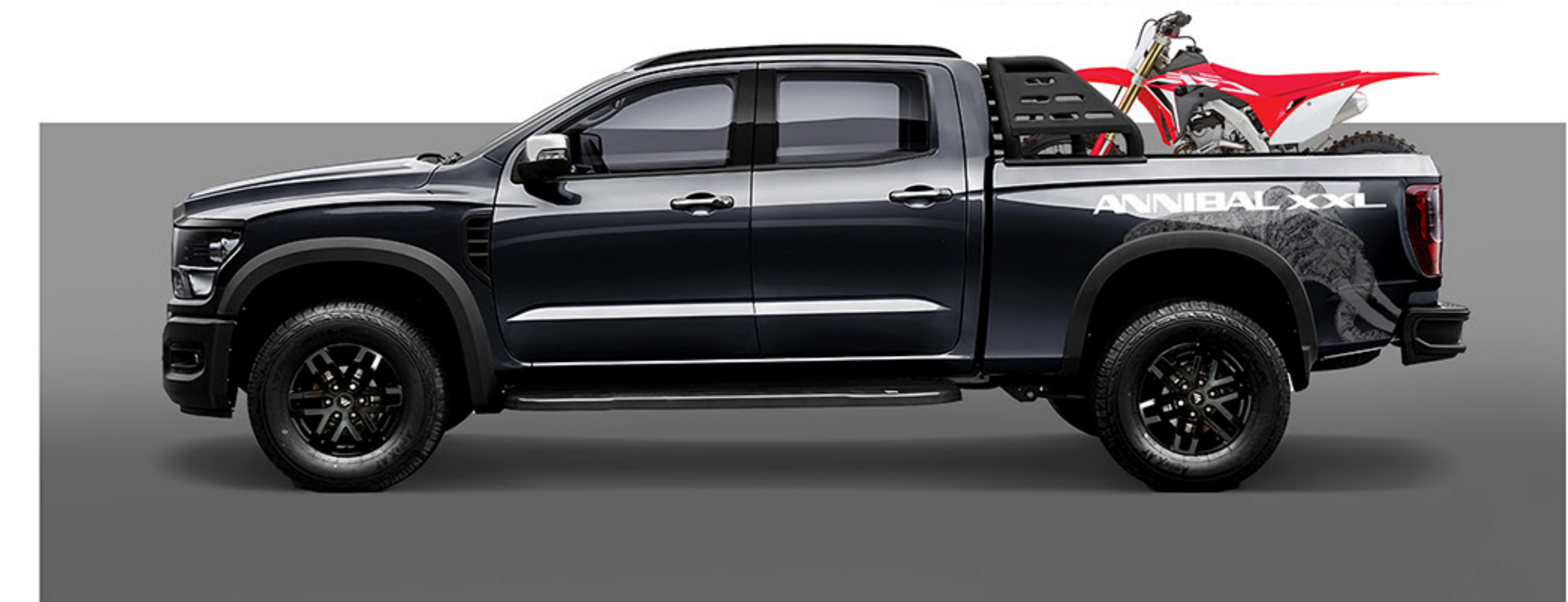
Un design statuaire qui se marie avec des lignes menaçantes et robustes.